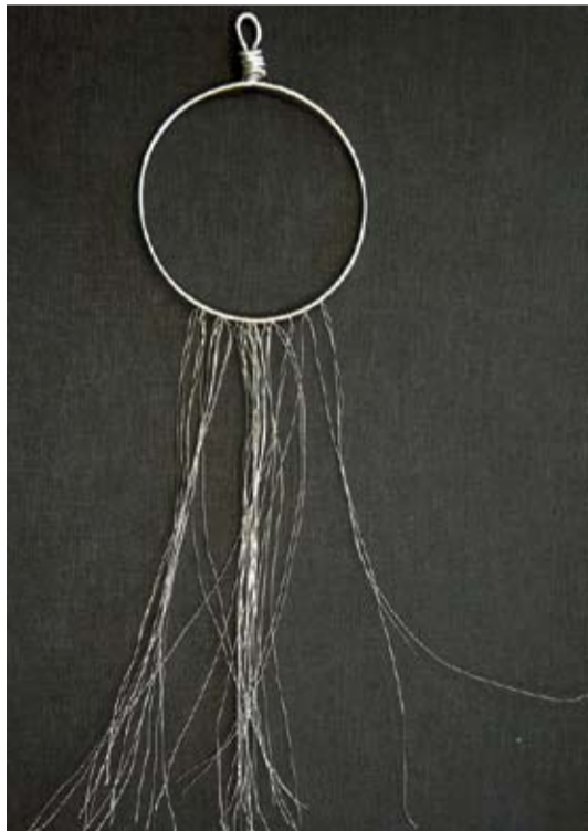
2. att. Uz pamata formas nostiprina vēlamo skaitu smalkākās stieples pavedienu.