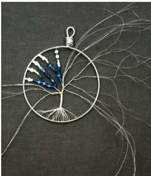
4. att. Uz zariem ver vēlamās krāsas un izmēra pērļītes līdz pamata stieplei. Smalkās stieples galu aptin ap pamata stiepli, lieko nokniebj.