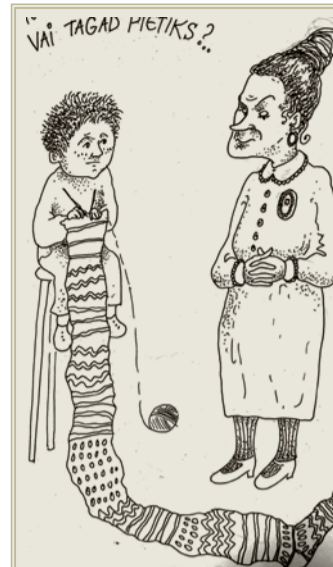
Martas Kreituses zīmējums

Smiltenes tehnikumā plkst. 10.00 notiks Latvijas profesionālās izglītības iestāžu audzēkņu profesionālās meistarības konkursa „Ēdināšanas