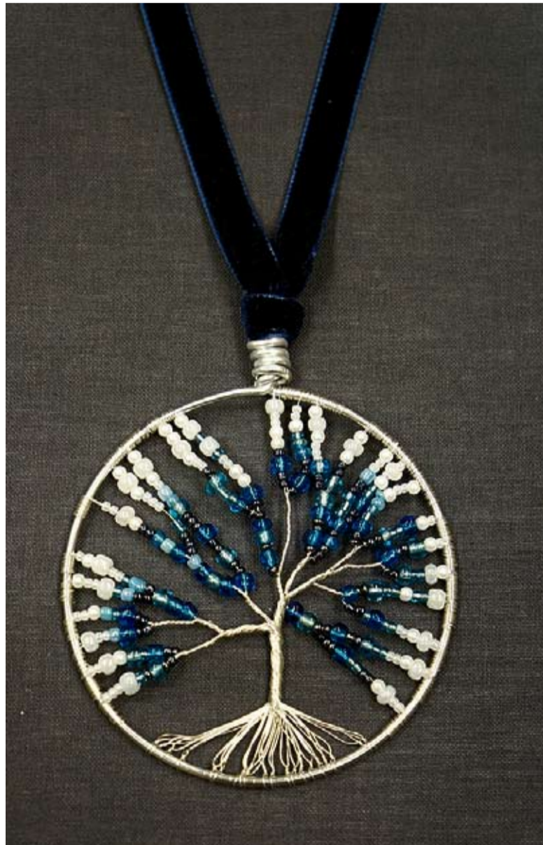
5. att. Katrs pats savam pērlišu kokam var meklēt simbolisko nozīmi vai dekoratīvo lietojumu.