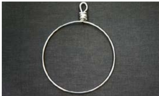
1. att. No stieples izveido apli vai citu formu. Lai izveidotu precīzu apli, stiepli liec ap, piemēram, pudeli.