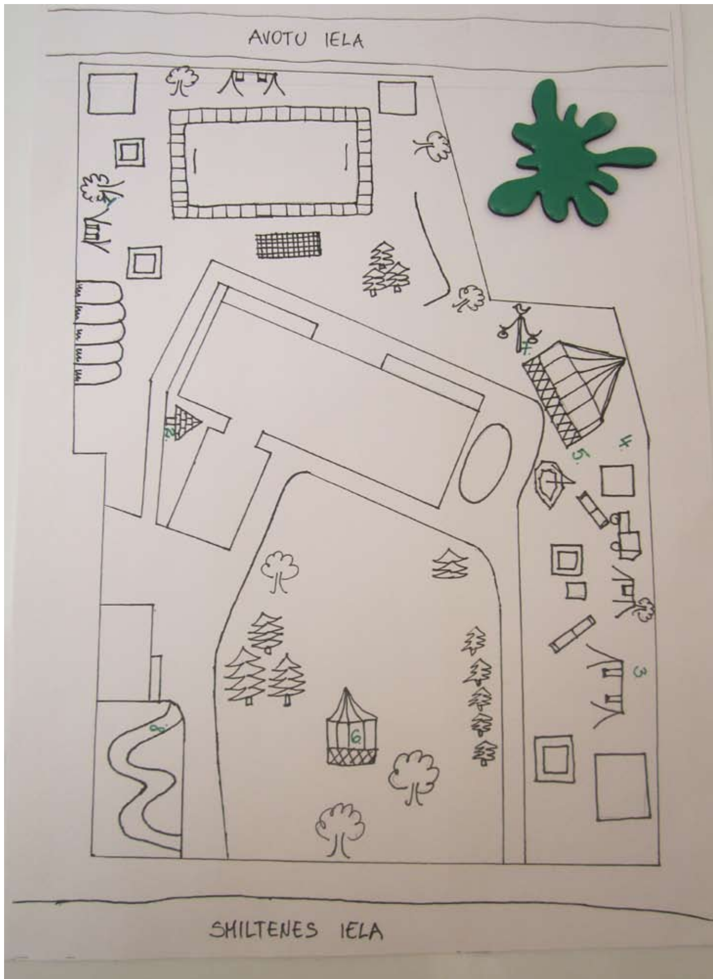
Māršruts bērnudārza teritorijā ir paredzēts jaunāko grupu bērniem.